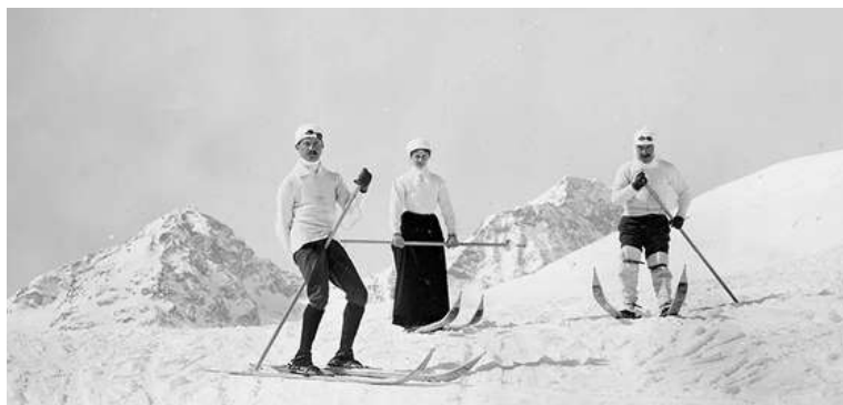
Photo de 1890 tiré de l'album : l'histoire de la Suisse au Musée national suisse.

Le ski en Suisse commence réellement à gagner en popularité à la fin du 19 e siècle, grâce à l'essor du tourisme alpin. Des stations comme Saint-Moritz, fondée en 1864, deviennent des destinations prisées pour les vacanciers en quête d'activités hivernales.